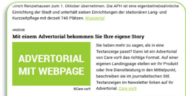
Darstellung im Newsletter

Sollten Sie keinen Text für das Advertorial liefern können, bieten wir Ihnen an, den Text zu schreiben. Dafür berechnen wir 500 Euro. Das Advertorial ist nicht weiter rabattfähig. Bei Schaltung über eine Mediaagentur gewähren wir 15 Prozent Agenturprovision. Alle Preise zuzüglich Mehrwertsteuer.