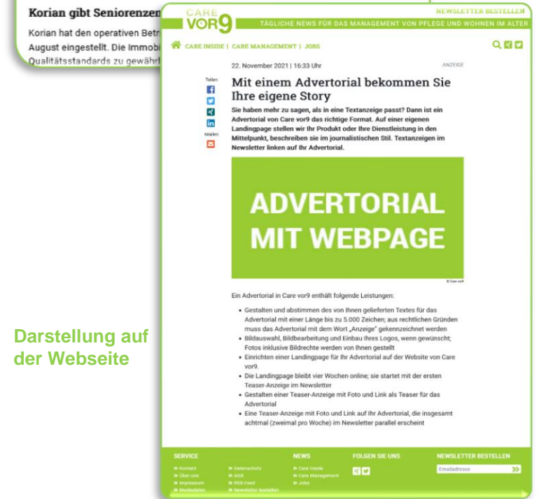
Darstellung auf der Webseite