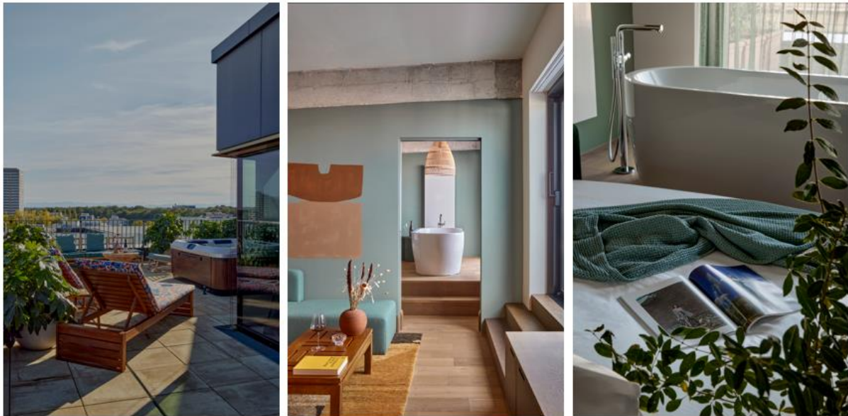
[Die WunderLocke Penthouse Suite]

Für die Suiten im siebten Stock spiegelte Holloway Li die Landschaft der Alpen in der Ferne zum seitlichen Fluss der Apartments wider. Die 31 m 2 großen Suiten mit einem Schlafzimmer und offenem Schnitt auf dem Dach verfügen über Dachterrassen, Wohnräume und voll ausgestattete Küchen mit Esstischen und vielem mehr.