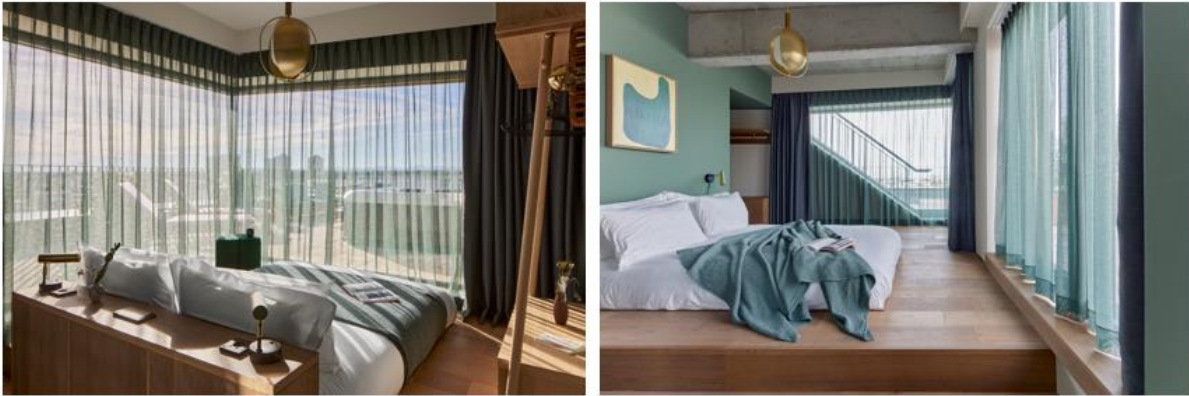
[L: Die WunderLocke Penthouse Suite, R: Die Penthouse Suite mit zwei Schlafzimmern]

Das in Sendling, München im Juli 2022 neu eröffnete Aparthotel WunderLocke, der wegweisenden Lifestyle - Marke Locke, hat seine Dachsuiten im siebten Stock und beeindruckenden Penthouse-Suiten enthüllt. Die 360-Apartment-Destination liegt ideal im aufstrebenden Stadtteil Sendling und bringt ein Hospitality- Konzept wie kein anderes in die bayerische Landeshauptstadt. WunderLocke bietet Suiten für Urlauber und Geschäftsreisende gleichermaßen, elf offene Suiten mit einem Schlafzimmer, drei Penthouse-Suiten mit zwei Schlafzimmern und die WunderLocke Penthouse Suite an.