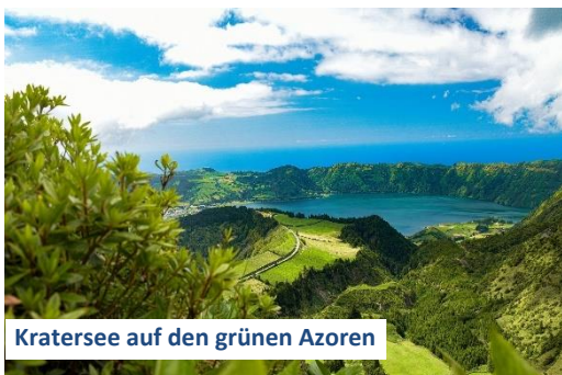
Kratersee auf den grünen Azoren

Neu im Programm: die einmalige Natur- und Tierwelt der Azoren