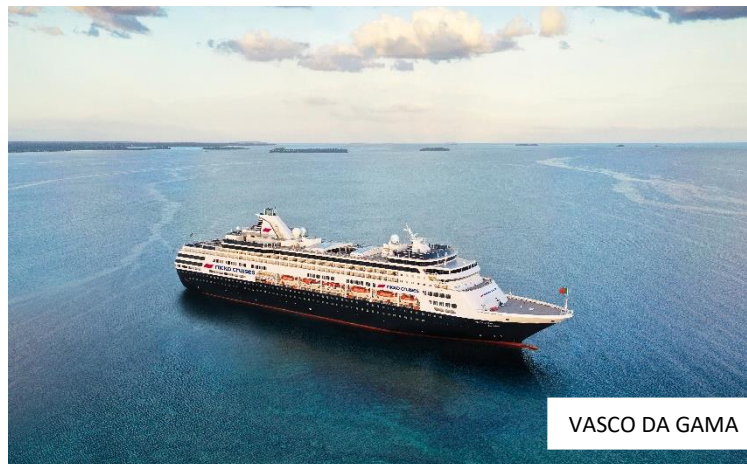
VASCO DA GAMA

Die nicko cruises Schiffsreisen GmbH startet einen Buchungswettbewerb für die Weltreise mit VASCO DA GAMA: Bei Buchung einer Kabine für die „kleine“ oder „große“ Weltreise im Buchungszeitraum vom 15. Dezember 2022 bis zum 31. März 2023 geht für die Reisebüropartner automatisch ein Los in die große Lostrommel