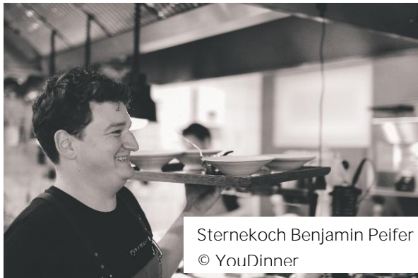
Sterne Koch Benjamin Peifer

Der Sternekoch und Gastronom Benjamin Peifer schwingt vom 25. auf den 26. März 2023 die Kochlöffel an Bord von nickoSPIRIT. Mit neuen Kreationen sowie mit perfekt ausgewählten und abgestimmten Zutaten zündet er ein kulinarisches Feuerwerk. Über seinen ersten Michelin-Stern durfte sich der junge Koch bereits 2014 freuen.